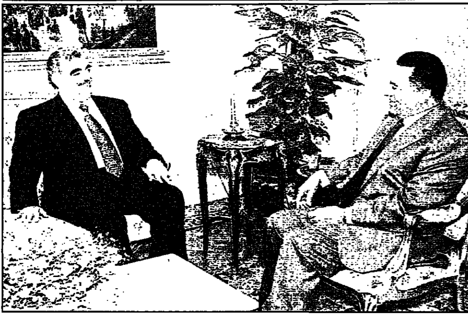
الرئيس المصري حسني مبارك لدى استقباله رئيس الوزراء اللبناني اسن في القاهرة

وقبل القصف اعان حزب الله مسؤوليته عن هجومين استهدفتا الجيش الاسرائيلي في الاحدية (القطاع الشرقي) وبيت ياحون (القطاع الغربي) مشيرا الى انها محققا واصابات على مسجد اخر اعرض حزب الله اللبناني الشيعي اسن الاربعة عن رغبته في ان تقوم الامم المتحدة بالتفاوض مع